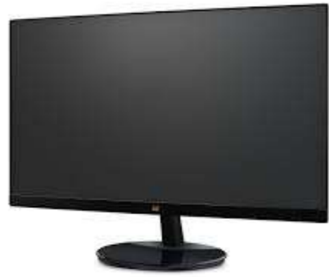
Affichage complet HD 22"