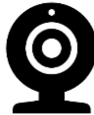
Lecteur de OCR