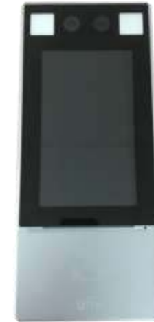
Contrôle de l'accès à la température