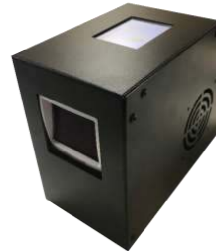
Système d'enregistrement Check & Pass