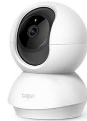
Caméra IP C-200 TP-Link 360°