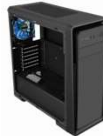
CPU i5 94004 GB 1550 GTX